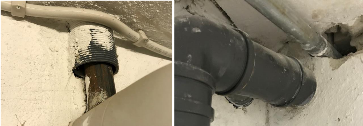
Figur 1: Manglende brandtætning ved installationsgennemføring