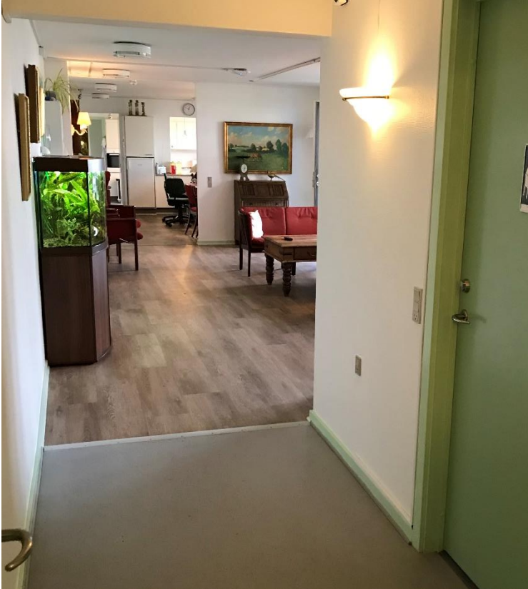
Figur 2: Manglende fribredde på 2.4 m, jf. BR82 pkt. 6.11.4 stk. 2.

Den fri gangbredde til flugtvejsgange er 2,4 m i henhold til BR82. Denne bredde kunne genfindes i byggeriet.